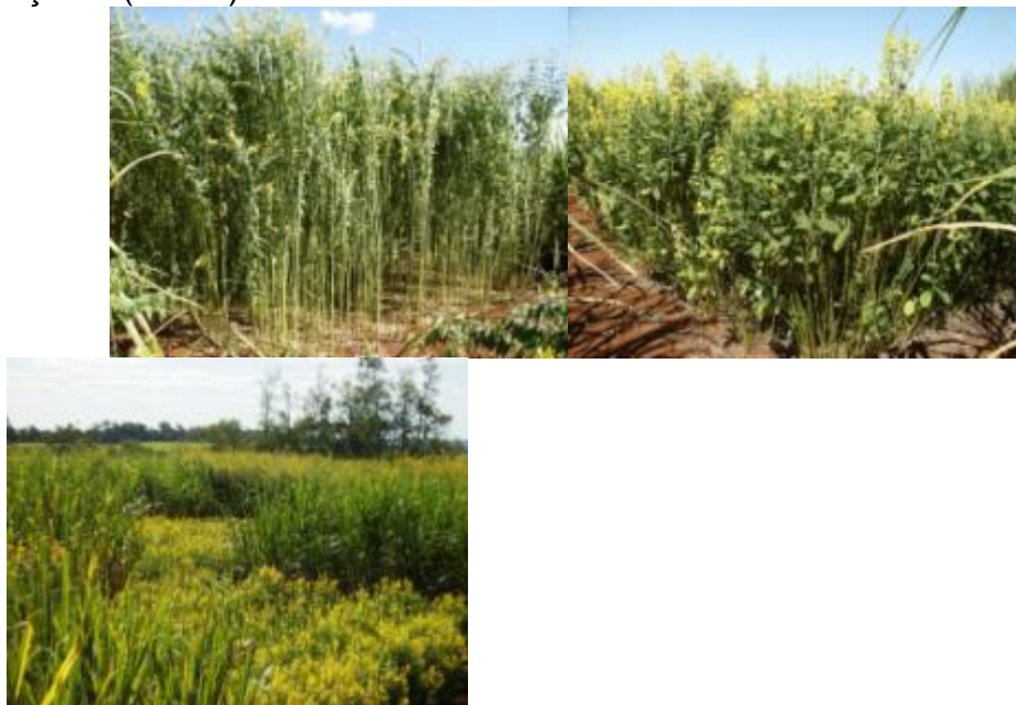
Figura 3. Crotalaria juncea (esquerda), Crotalaria spectabilis (centro) e a cana-de-açúcar (direita) - 10 de abril de 2010

Ambas as espécies das crotalárias apresentaram significativos valores de produção de matéria verde/seca e adição de macro e micronutrientes ao terreno, demonstrando ser uma eficiente técnica de recuperação de solos e de adubação verde (MIYASAKA, 1984, p. 64-123; ALBUQUERQUE et al. , 1980; MASCARENHAS et al. , 2003, p. 18-20), conforme registro nas Tabelas 1 e 2.