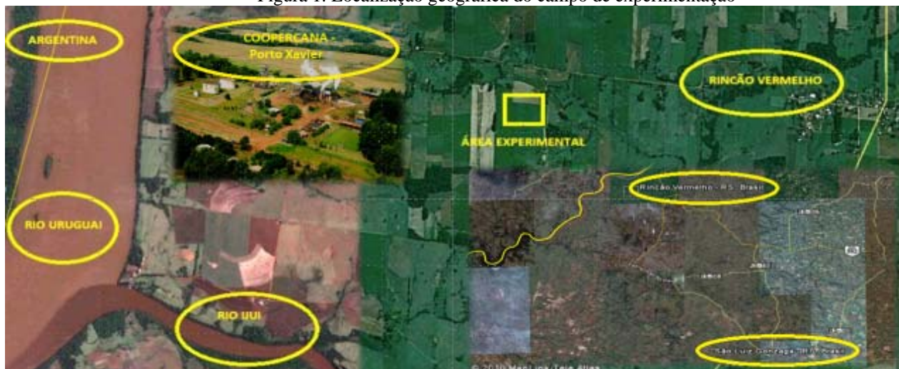
Figura 1. Localização geográfica do campo de experimentação

O solo do campo experimental é um Latossolo argiloso, ocupando uma área de 1.071,20 m 2 (metros quadrados), cada parcela mede 33,6 m 2 , 8,0 m de comprimento e 4,2 m de largura, 2,0 m entre espaçamento, considerando útil para os estudos as linhas centrais do plantio. O delineamento experimental adotado foi o de blocos ao acaso, em esquema fatorial 3x5 (três repetições e cinco parcelas).