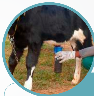
Fig 3. Cura do umbigo com solução de iodo a 7%

Há vacas que não conseguem produzir colostro, principalmente devido à baixa oferta nutricional em determinadas épocas do ano, além de casos de morte das mesmas ao parto ou mastites durante o período final da gestação. A fim de garantir um bom colostro para as bezerras, é aconselhável manter na propriedade um banco de colostro. O ideal é que toda vaca sadia recém-parida seja ordenhada e o seu colostro seja avaliado com um colostrômetro. Se o colostro for de qualidade intermediária ou alta, recomenda-se o armazenamento do mesmo. É aconselhável armazenar apenas o colostro do primeiro dia após o parto, o qual possui qualidade superior de anticorpos quando comparado aos demais dias. O colostro deve ser congelado no freezer à temperatura de -20°C. Pode-se congelar porções individuais de um ou dois litros devidamente identificados com a data de congelamento e do animal. O descongelamento do colostro deve iniciar sempre do frasco mais antigo e deve ser feito em banho-maria com água a 45°C.