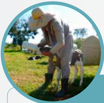
Fig 1. Bezerra recebendo colostro via mamadeira

Trinta dias antes do parto, as vacas gestantes devem ser encaminhadas ao piquete maternidade para o início da dieta de transição e o acompanhamento do parto. É importante que o piquete maternidade esteja localizado onde o tratador possa realizar o acompanhamento diário, e vigília constante, principalmente a partir dos primeiros sinais de parto. É ideal que haja uma maternidade para vacas e outra para novilhas. O local ideal para o parto é um ambiente com boas condições de higiene, seco, com boa drenagem e cobertura vegetal, que ofereça conforto aos animais, área de sombreamento (4 m 2 / animal), com baixa taxa de lotação e espaço de cocho suficiente (70-100 cm/ animal).